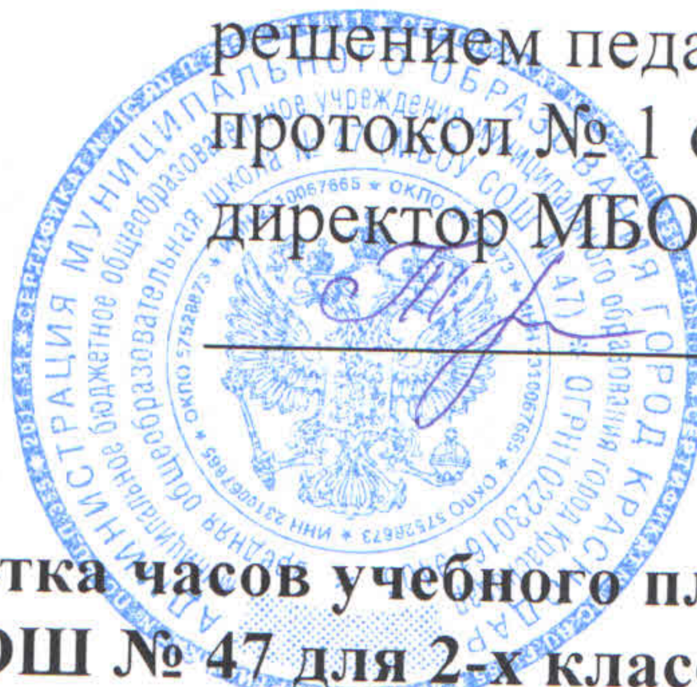
Таблица-сетка часов учебного плана МБОУ СОШ № 47 для 2-х классов, реализующих ФГОС НОО 2012– 2013 учебный год