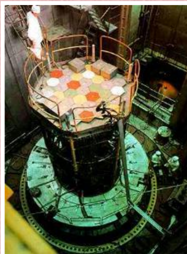
Реактор атомного ледокола «Арктика».

В 1975 г. на установке «Токомак-10» впервые была осуществлена управляемая термоядерная реакция. В к. 60-х гг. в СССР была создана Единая Энергетическая Система. В 1965 г. был создан транспортный самолет «Антей». В 1975 г. началась эксплуатация сверхзвукового пассажирского самолета ТУ-144. В 1976 г. появился 1-й советский «аэробус»-Ил-86. В 1975 г. начался выпуск карьерных самосвалов БЕЛАЗ-110, началась эксплуатация атомного ледокола «Арктика».