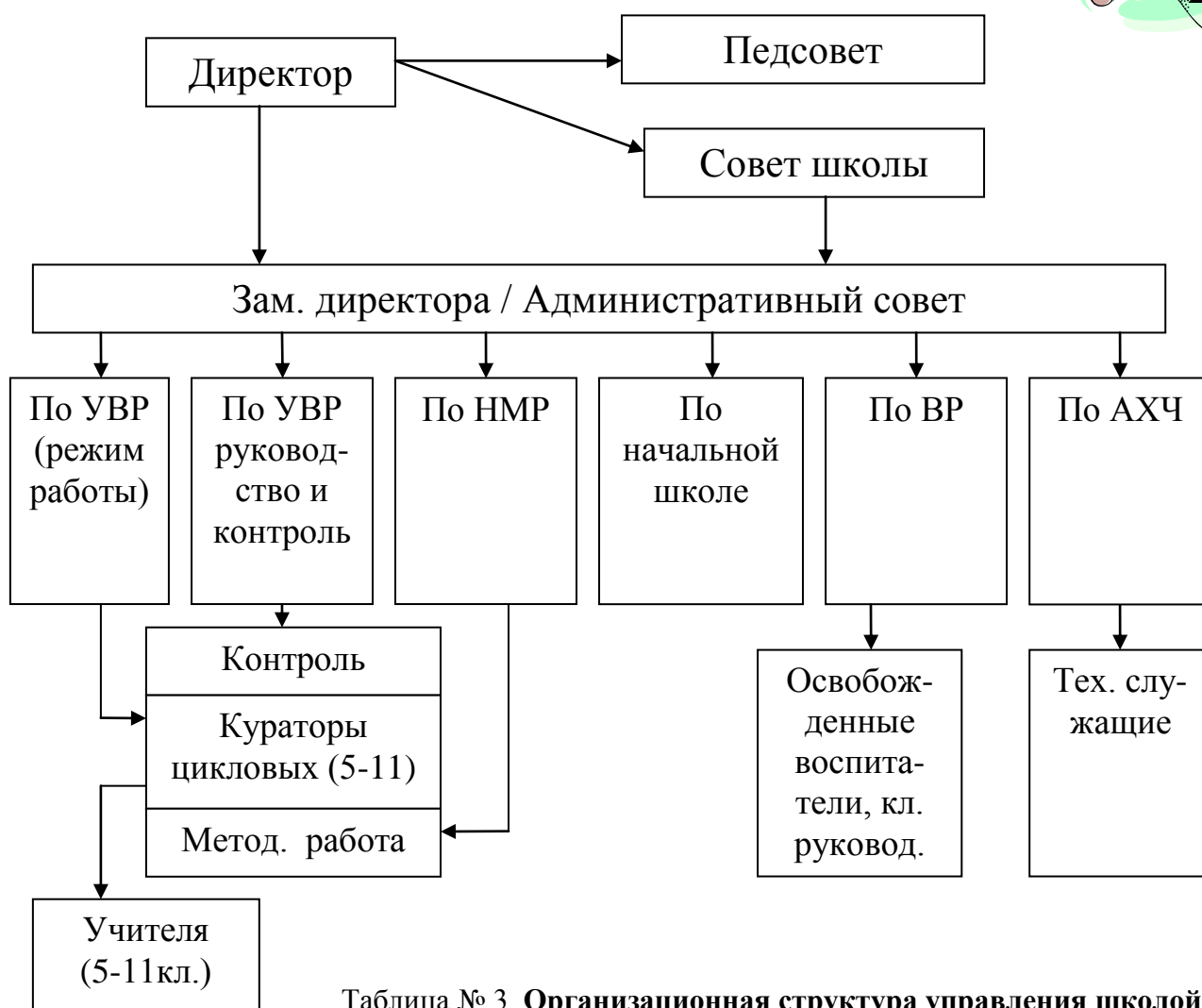
Таблица № 3. Организационная структура управления школой.