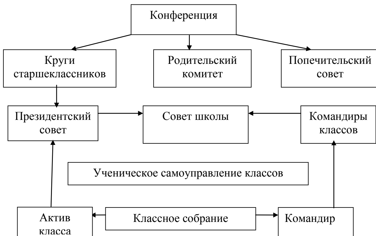
Таблица № 4. Структура органов самоуправления школы.